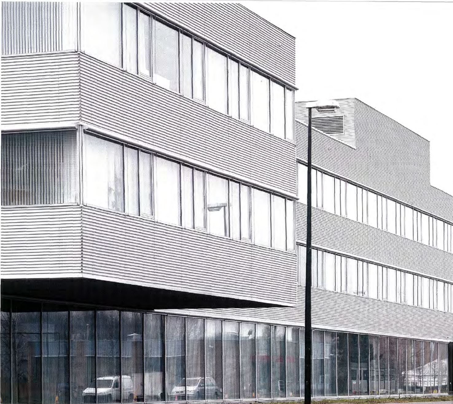
Offices / Shops