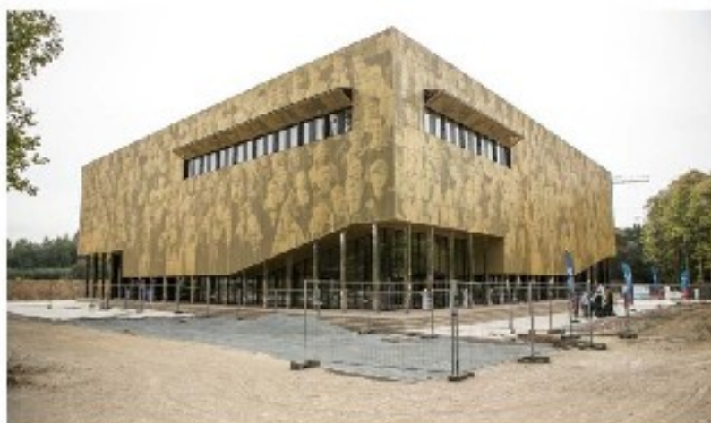
Op de gevel van het gebouw Gouverneur Andries Kinsbergen werd een foto van studenten en docenten geponst in gouden aluminium platen. Pas op grotere afstand zijn hun gezichten goed te zien.

Het gebouw, naar het ontwerp van META architectuurbureau, valt vooral op dankzij de 'fotogevel' van de Antwerpse Britse kunstenaar Perry Roberts. Op de gevel werd een foto van studenten en docenten geponst in gouden aluminium platen. Per vierkante meter zijn er zeventien geponst gaten. Van dichtbij zijn de gezichten amper te zien. Op een grotere afstand wordt het beeld pas echt zichtbaar. Binnen valt vooral het