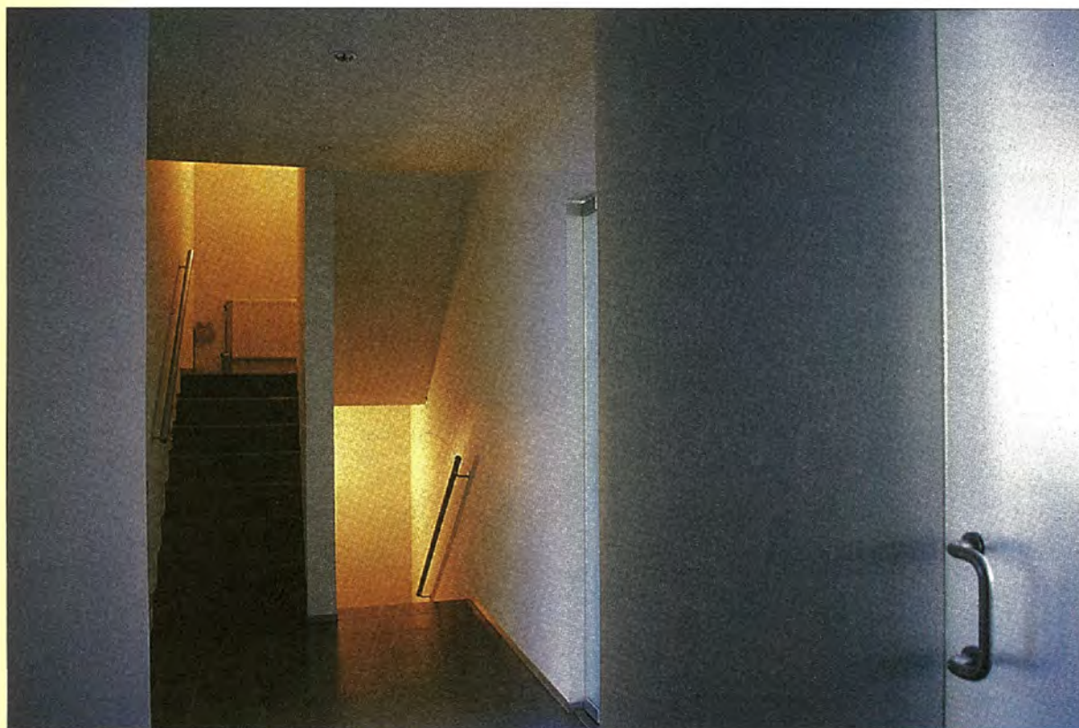
De traphal en (onder) de gevel met uitspringende stenen.

Beschut wonen in de Familiestraat in Antwerpen