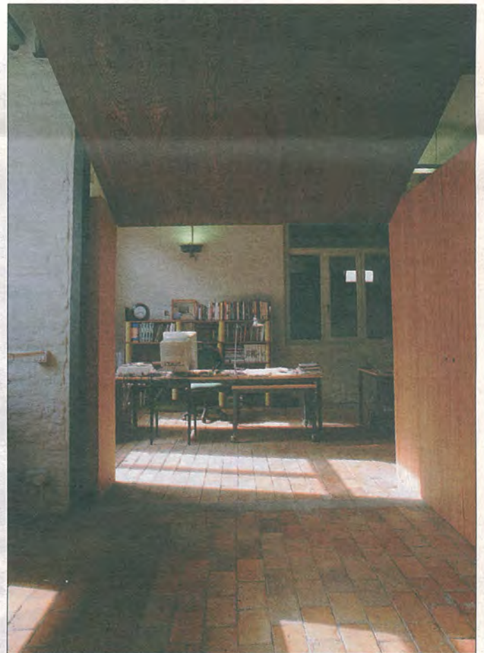
Architettura, Thierry Lagrange & Patrik Steels: woning met kantoor, Gent.

PHILIPPE VIÉRIN & NOA: KANTOORGEBOUW Tel.: 050-44.30.70, e-mail: architecten.noa@bigfoot.com