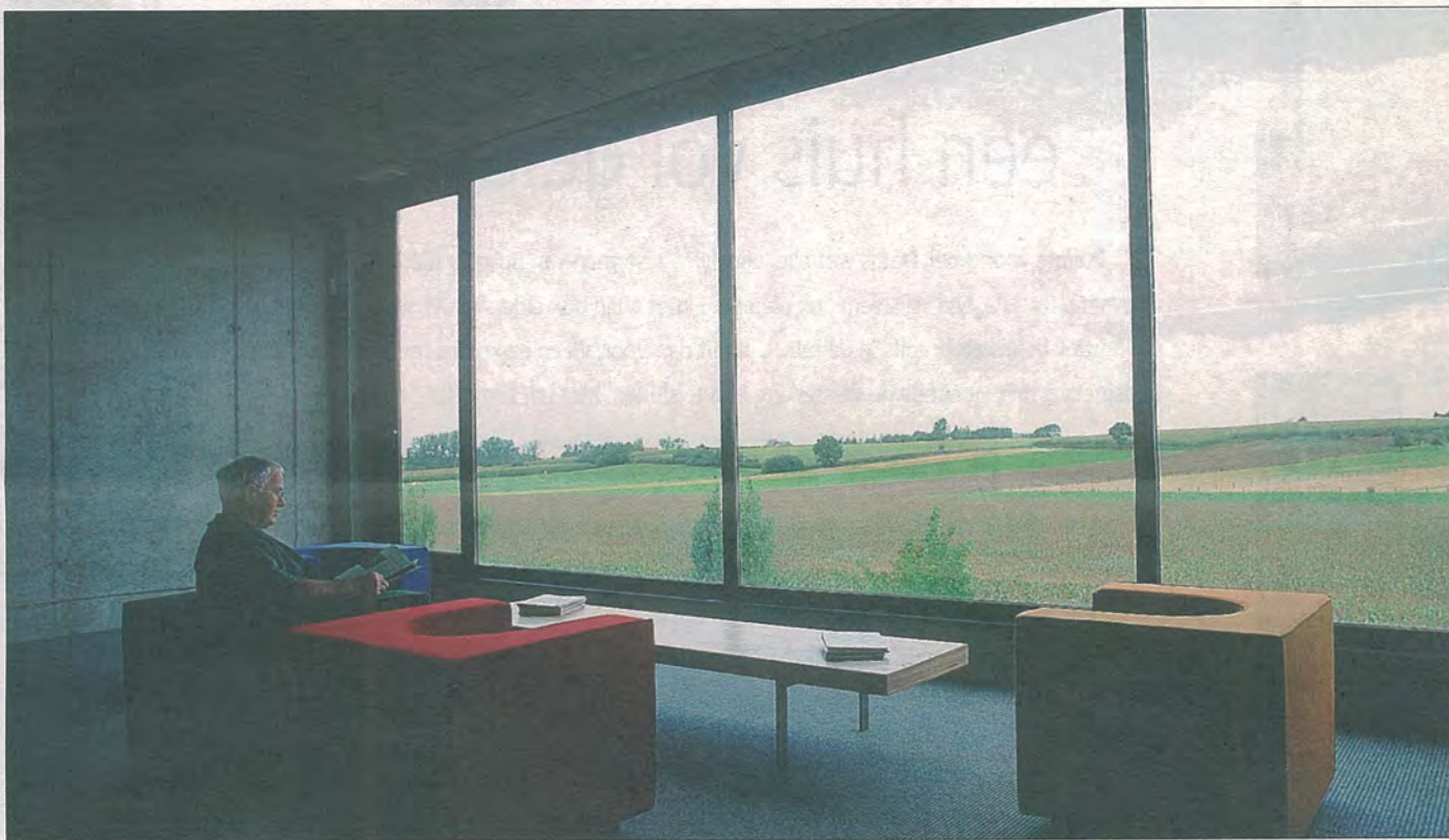
Meta-architectenbureau: handelspand, Scherpenheuvel (foto's boven).